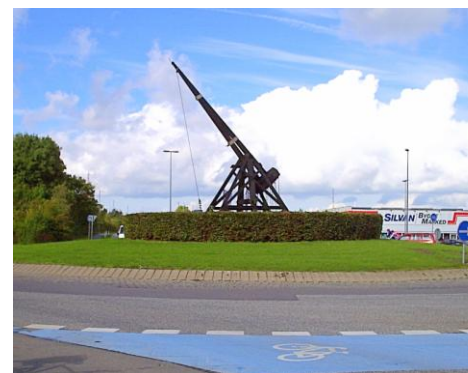
Bliden i rundkørsler på Prinsholmvej

1978, men er nu, som den første i Danmark genopført på sin oprindelige plads. Overfor ligger "Froms pakhus", som formodes opført af materialer fra nedrivningen af Slottet. Det benyttes af Guldborgsund Museum.