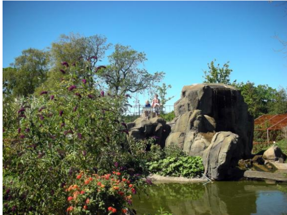
Zoo, Nykøbing Falster

Til venstre ad Østre Allé er Zoo Nykøbing Falster, men ruten går ligefrem, forbi Folkedanserhuset.