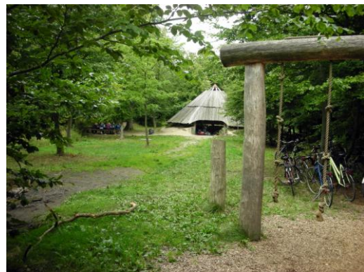
Bålpladsen i Bangsebro Skov

Turen går gennem skoven forbi B1901's baneanlæg og videre over Stubbekøbingvej. Via Rundkørselen og Energivej kommer man forbi Refa's store forbrændingsanlæg, ad cykelstien gennem kolonihaverne ved Åhaven og til Bangsebroskoven. Inde i skoven kommer man forbi en bålplads, hvor der er borde og bænke og en stor hytte. Her kan man nyde den medbragte kaffe, inden man kører videre til Kraghave.