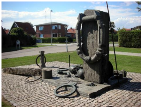
Ved Vestensborg Allé/Katedralskolen