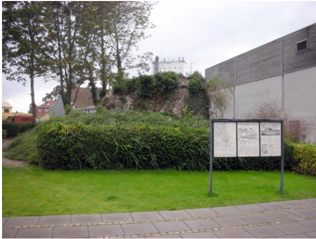
Slotsruinen foran Biografen

På den anden side af Slotsbryggen, foran biografen, står den sidste rest af Nykøbing Slot. Det er resten af det tårn, som blev kaldt "Fars Hat". På informationstavlen kan man se, hvordan Slottet har ligget i forhold til byens nuværende grundplan.