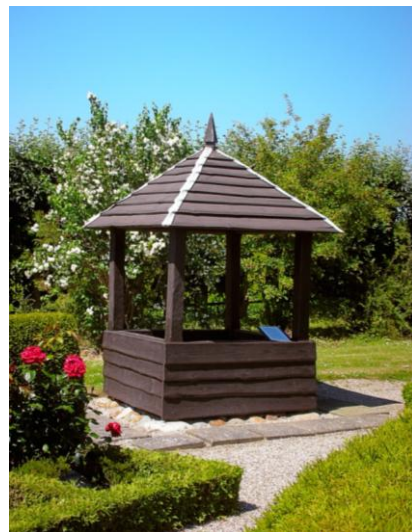
Sct. Søren's Kilde

Videre ad Gårdrækkevej til Storstrømsvej, som følges til Nørre Vedbyvej.