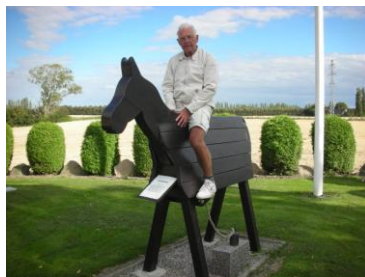
Ved Kippinge Kirke