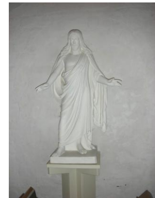
Kristus figur i Eskilstrup Kirke

Kør ad Skovvej til Bannerupvej og følg den til Eskilstrup, hvor der drejes ad Tårngade til Eskilstrup Kirke, som er vejkirke og hvori der også findes kalkmalerier fra omkring år 1300. Lige overfor indgangen ses en Kristus figur af Bertel Thorvaldsen stående i en niche, som tidligere var kvindedør. Kør videre gennem Eskilstrup og drej til venstre ad Jernbanegade og til Nørregade 17. Her ligger, i en tidligere fabriksbygning fra 1918, Danmarks Traktormuseum,