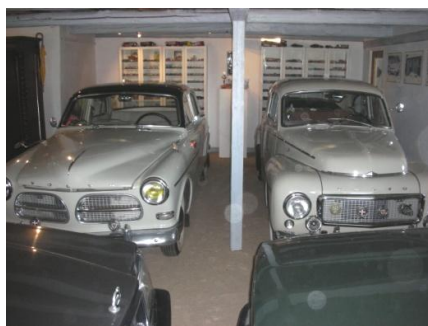
Volvo biler og galleri på Barup Søvej 7