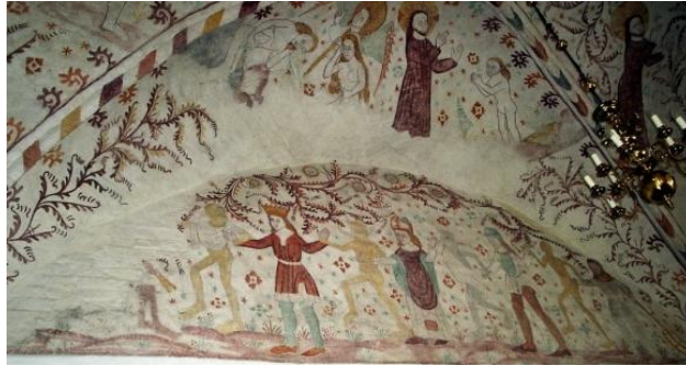
"Dødedansen" i Nørre Alslev Kirke

Start ved Nørre Alslev Kirke. I kirken er der kalkmalerier fra tre perioder. I apsis findes Danmarks ældst daterede fra 1308. Over triumfbuen findes Domsscenen fra omkring 1375 og på vestvæggen over buen til tårnrummet findes Elmelunde-mesterens Dødedansmotiv fra ca. 1500. Det er et af de få bevarede i Danmark og viser en konge, en biskop, en borger og en bonde, som danser med dødnige. Udtrykket "at ligne døden fra Lübeck" stammer fra samme motiv i Marienkirche i Lübeck, som desværre blev ødelagt under krigen.