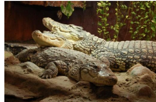
Nilkrokodiller i Krokodille Zoo

med Danmarks største samling på over 200 traktorer og motorer fra perioden 1898 til 1978. Kør tilbage og følg Østergade og Nybyvej til Ovstrupvej, hvor Krokodille Zoo ligger på Ovstrupvej 9.