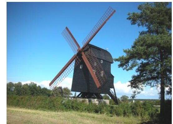
Stubmøllen i Torkilstrup

Her kan man på nært hold opleve verdens næststørste samling af krokodiller med 22 af